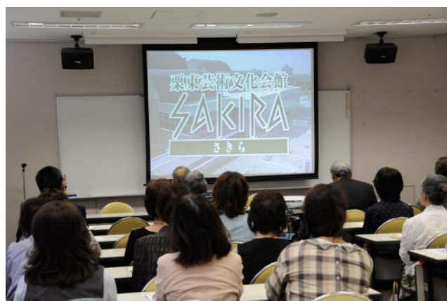
建設の経緯などをビデオで説明